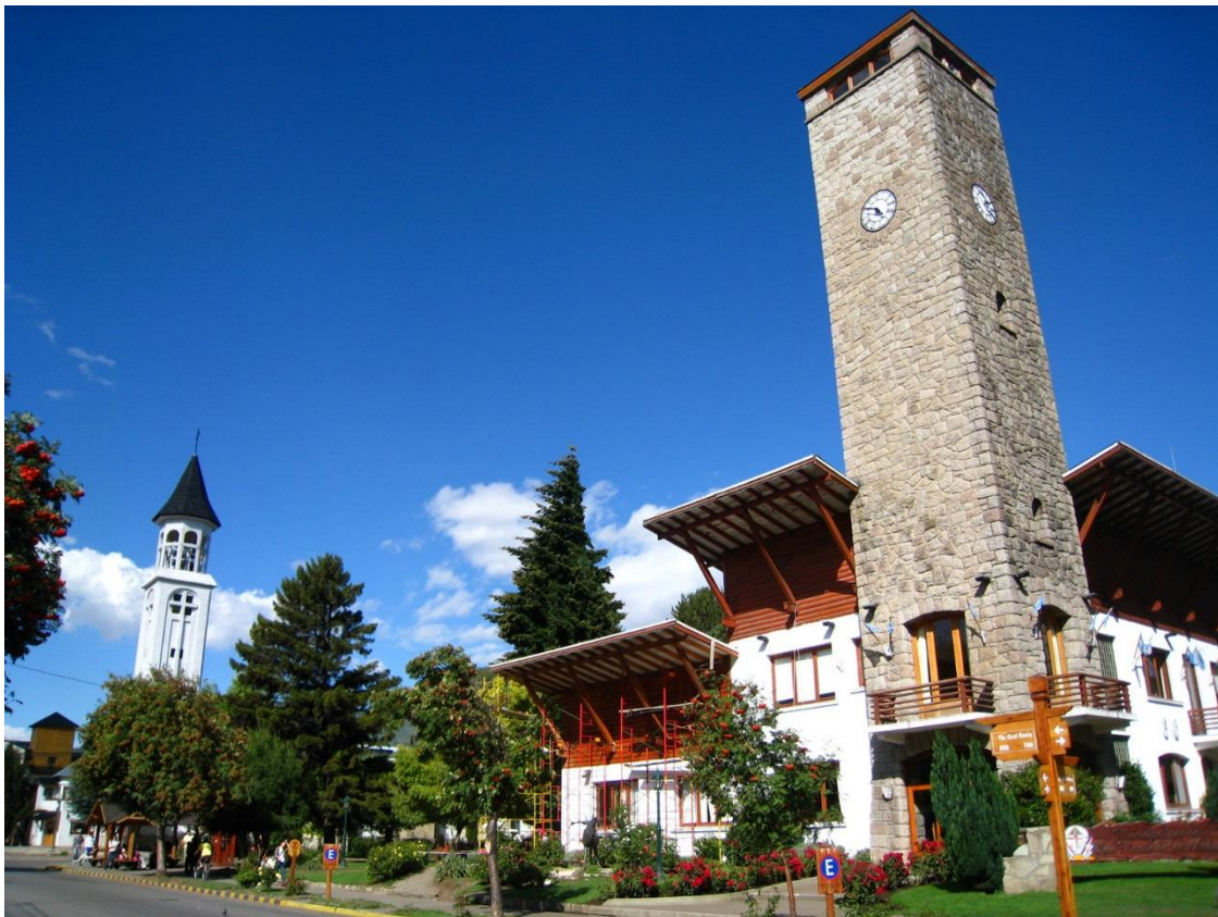
San Martín de los Andes.

17 de junio de 2015. trivago Argentina www.trivago.com.ar , el mayor comparador de precios de hoteles del mundo, presenta su tHPI (Índice de Precios Hoteleros de trivago) del mes de junio 2015. Los datos se basan en el precio promedio por noche en una habitación doble estándar y en la información extraída de las plataformas de trivago.